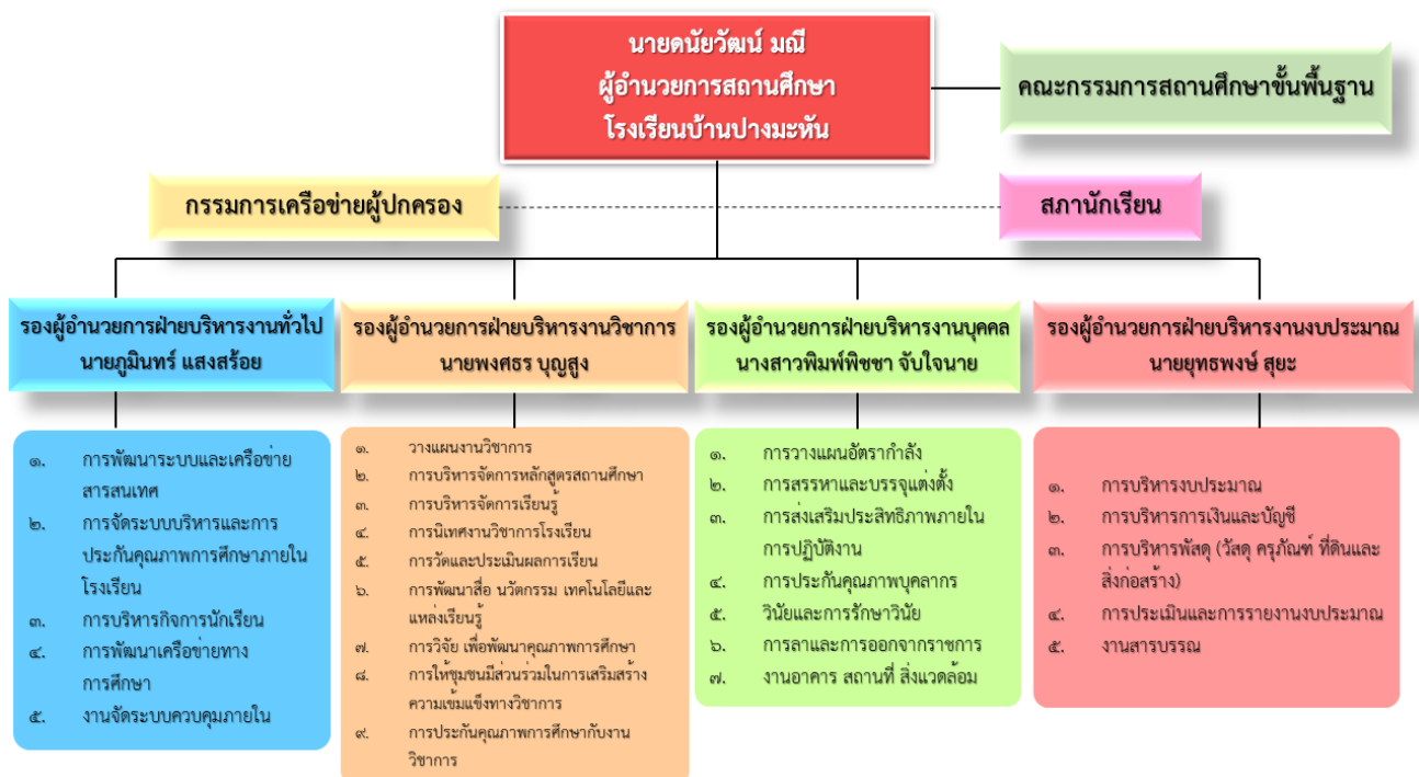
แผนภาพที่ ๑ การแบ่งส่วนราชการภายในโรงเรียนบ้านปางมะหัน